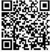
申込フォームQRコード