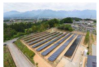
リユース品を使用した発電所