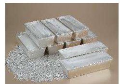
有用金属（銀）のイメージ