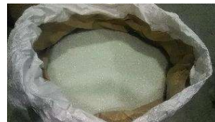
破碎・選別したガラス