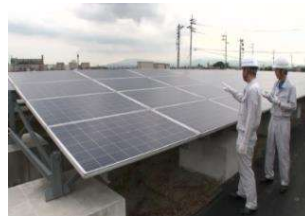
太陽光パネルの外観検査

使用済みとなった太陽光パネルについても、再販売可能なものもある。既に多くのリユース事例が報告されている。