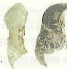
左) 正常な肺 右) じん肺に罹患した肺 (粉じんの吸入により肺が黒くなっている。)

現在、じん肺を治す根本的な治療がないため、じん肺にかからないための措置として、粉じんの発生源対策、局所排気装置等の適正な稼働、呼吸用保護具の適正な着用などにより、粉じんへの「ばく露防止対策」を徹底することが重要です。