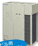
ビル用 マルチエアコン