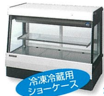
冷凍冷蔵用 ショーケース