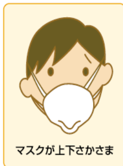
マスクが上下さかさま