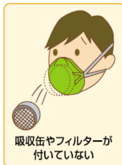
吸収缶やフィルターが 付いていない