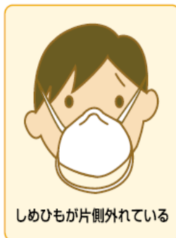
しめひもが片側外れている