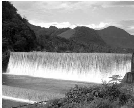
本宮堰堤 (重要文化財)

10月に開催される国際防災学会(インタープリバント)富山大会に先立ち開催する本シンポジウムでは、世界遺産の最前線で活躍する専門家による講演やパネルディスカッションをとおして、立山砂防の価値と魅力を広く世界に発信します。