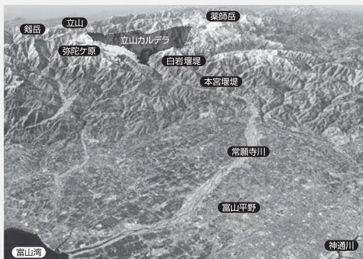
国土地理院の基盤地図情報標高10mメッシュを使用