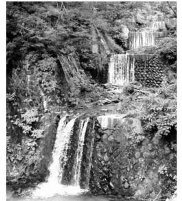
泥谷堰堤 (重要文化財)