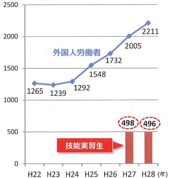
休業4日以上死傷者数（単位：人）