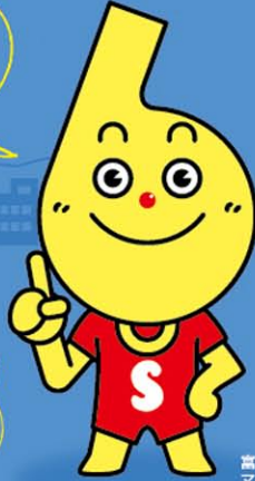
富山県安全なまちづくり マスコットキャラクター セーフティーくん

この10年間で、 地域の防犯活動が 活発に展開され、 県内の犯罪発生件数は 年々減少しています。