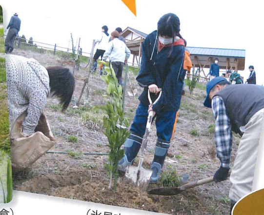
(氷見市大境・脇・姿)