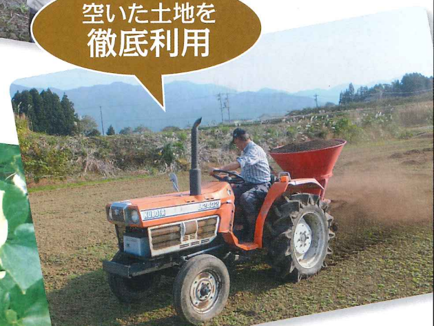
(南砺市京塚・南原)